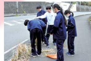
明桜館クリーンタイム