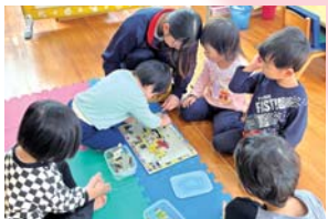
児童館ボランティア