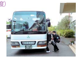
下校時の校内ロータリーの様子