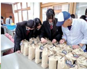
八重山桜仕上げ作業