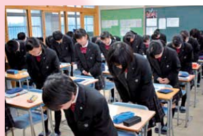
授業の開始・終了時の丁寧なあいさつ