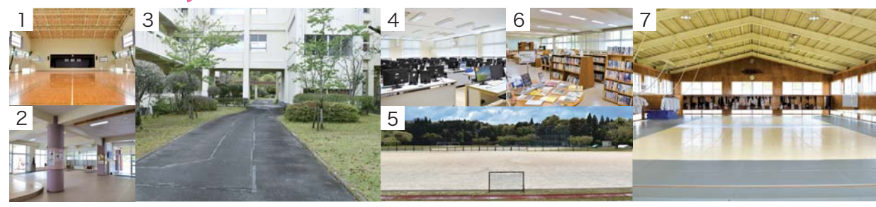
1 体育館 2 多目的ホール(各階) 3 中庭アプローチ 4 パソコン室(4カ所) 5 グラウンド 6 図書室 7 柔道場