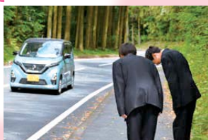
甲陵坂では、行き交う車や人に対して丁寧なあいさつを励行しています