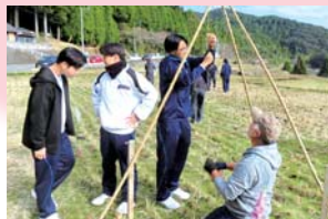
八重山棚田イルミネーション設置ボランティア