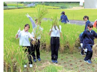
八重山棚田、八重山桜(商品名)の田植えの様子