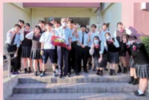
生徒によるバスの運転士の方へのお礼のせしモニー